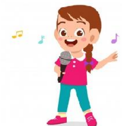
PEVKA (POJE PESMI)