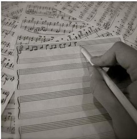
SKLADATELJ (PIŠE SKLADBE)