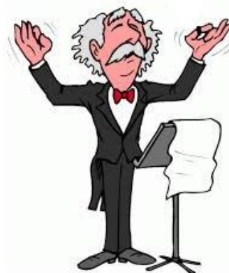
ZBOROVODJA (VODI, USMERJA PEVSKI ZBOR)