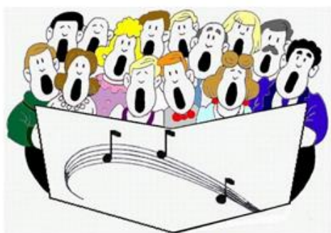
PEVSKI ZBOR (SKUPINA PEVCEV, KI POJEJO SKUPAJ)