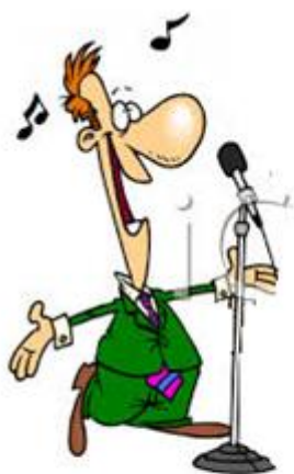
PEVEC (POJE PESMI)

POGLEJ SLIČICE IN PROSI STARŠE, DA TI PREBEREJO, KAR PIŠE POD NJIMI. NATO SAM POIMENUJ ČIM VEČ SLIČIC BREZ POMOČI.