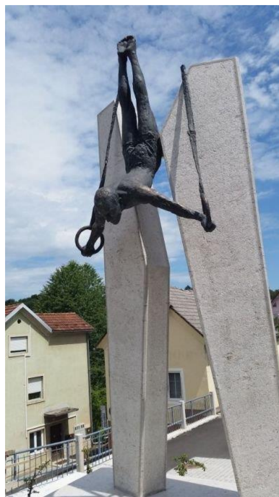
Kip Leona Štuklja v Novem mestu.

Leon Štukelj je bil slovenski telovadec. Rodil se je v Novem mestu. Na olimpijskih igrah je dosegel 6 kolajn. Dočakal je skoraj 101 leto.