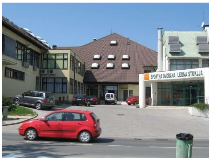
Športna dvorana v Novem mestu, ki se imenuje po Leonu Štuklju.