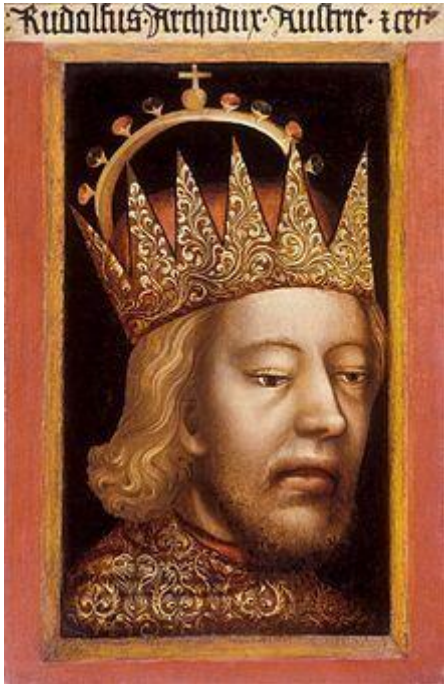
Rudolf IV. Habsburški, ustanovitelj Novega mesta

Ob ustanovitvi Novega mesta je bila meščanom zagotovljena osebna svoboda, mestna samouprava, lastni in voljeni sodniki, pravica do trgovanja in sejmov. Stoletje in pol je mesto cvetelo in postalo najpomembnejše med kraji na Kranjskem.