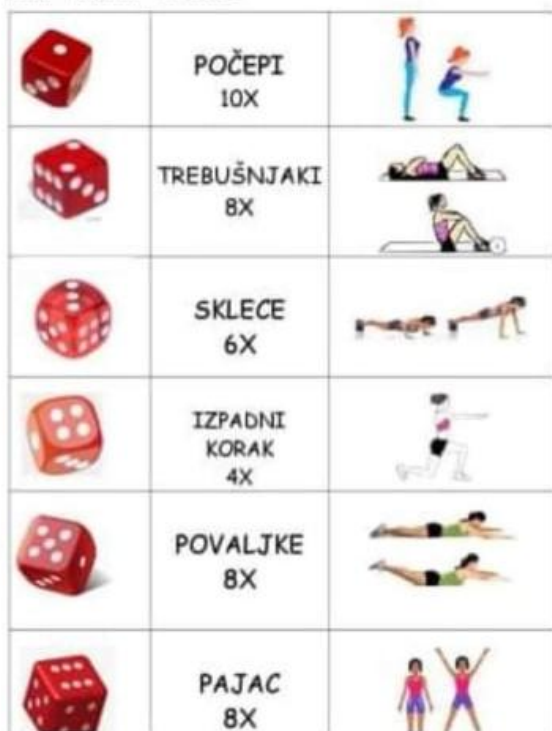
NAJ KOCKA ODLOČI

SKOK V DALJINO Z MESTA: Na spodnjem posnetku si večkrat dobro poglej, kako poteka skok v daljino z mesta. Ob ogledu posnetka poskusi enako storiti tudi ti.